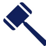
អាជ្ញាធរតុលាការ