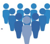
អង្គនីតិប្រតិបត្តិ